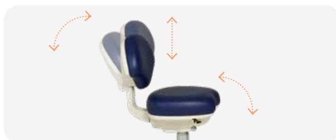
L'angolo di inclinazione dello schienale è regolabile in una posizione fissa o può supportare dinamicamente i muscoli della schiena.